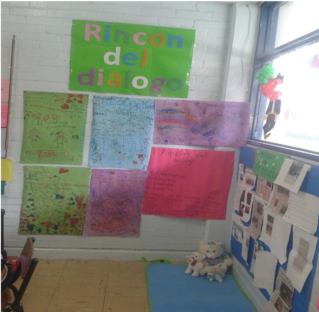
Rincón del diálogo en el aula del 2ºB