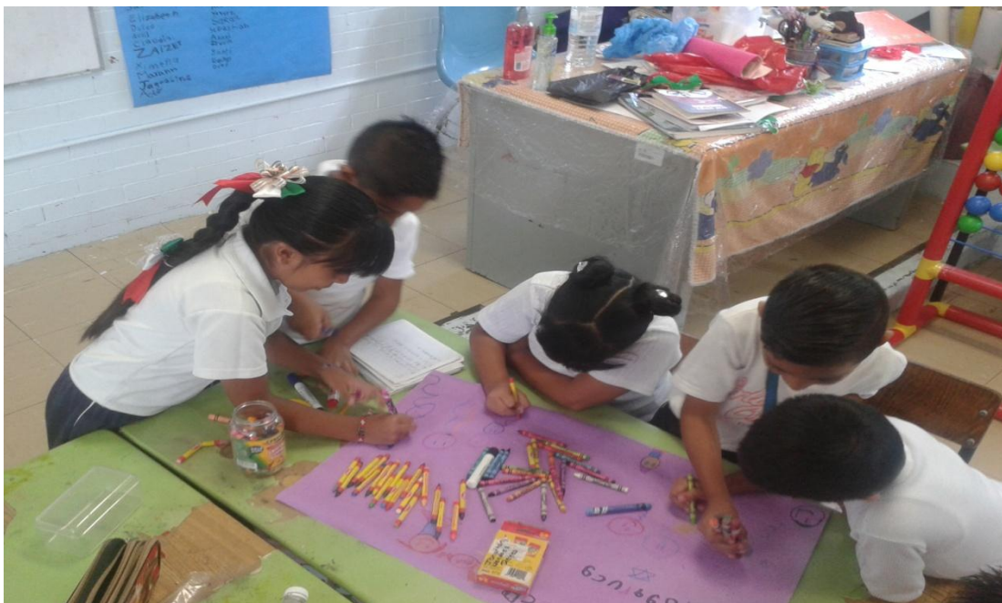
Alumnas y alumnos de 2ºB trabajando en equipo en la construcción del Rincón del diálogo .