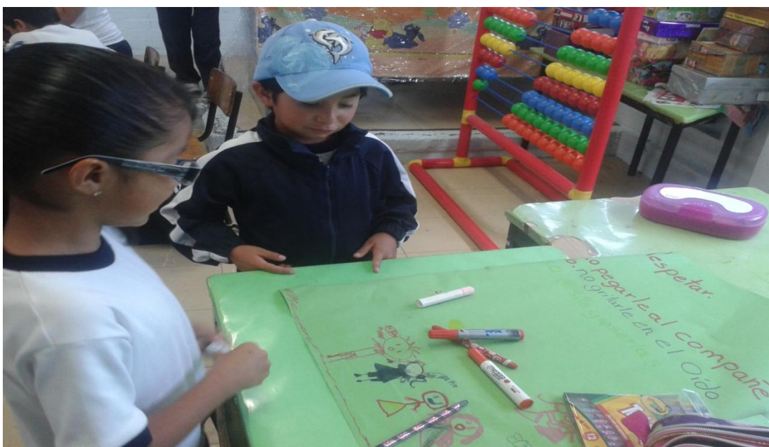
Alumna y alumno del 2ºB elaborando las reglas del Rincón del diálogo .